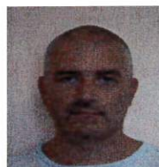
8) RIBOLDI DANIO